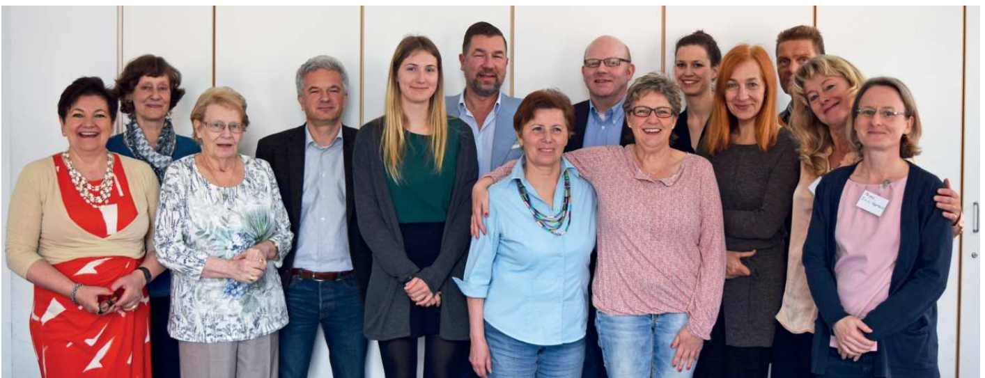
Erster Ausbildungsjahrgang Schlaganfallhelfer in Berlin 2017

Dieses Ehrenamtsprojekt gibt Interessierten die Möglichkeit, sich intensiv mit dem Krankheitsbild Schlaganfall auseinanderzusetzen und ihr Wissen an andere weiterzugeben und aktiv zu helfen. Die Schulungen finden jährlich statt, Anmeldungen sind jederzeit möglich. Aktuelle Informationen können auf der Homepage eingesehen werden.