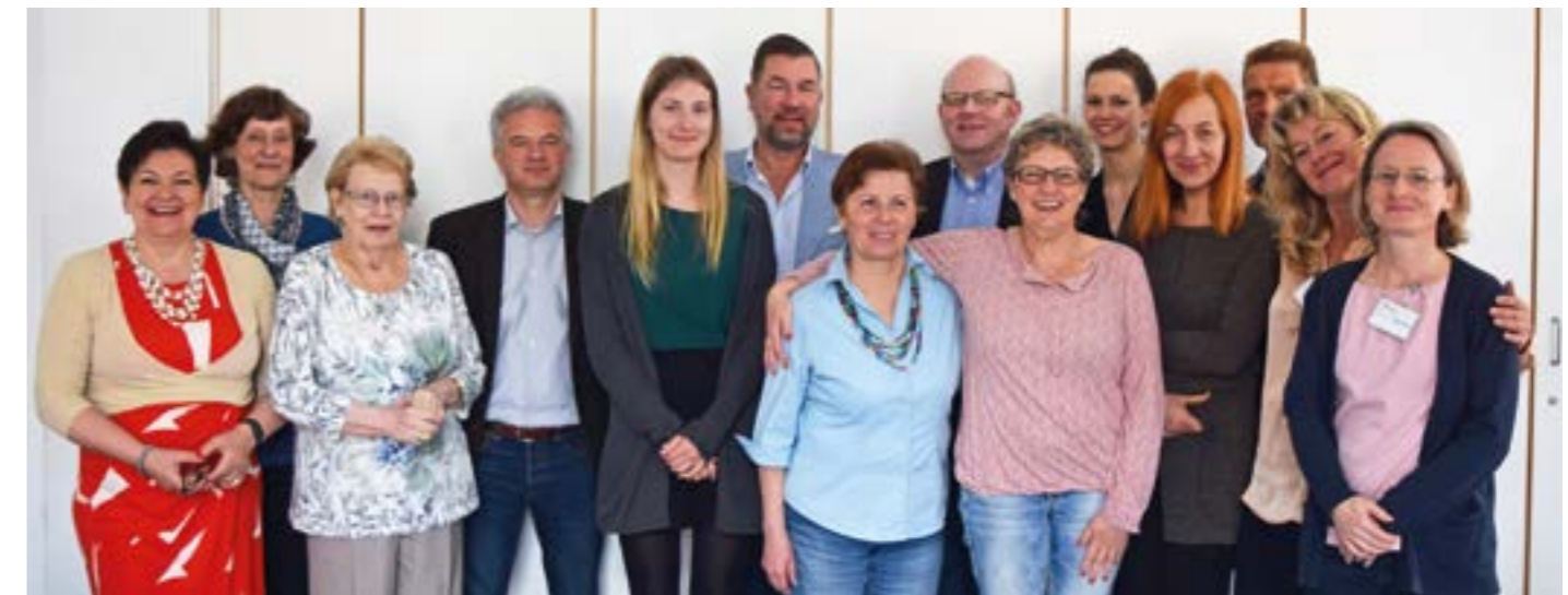
Erster Ausbildungsjahrgang Schlaganfallhelfer in Berlin 2017

Dieses Ehrenamtsprojekt gibt Interessierten die Möglichkeit, sich intensiv mit dem Krankheitsbild Schlaganfall auseinanderzusetzen und ihr Wissen an andere weiterzugeben und aktiv zu helfen. Die Schulungen finden jährlich statt, Anmeldungen sind jederzeit möglich. Aktuelle Informationen können auf der Homepage eingesehen werden.